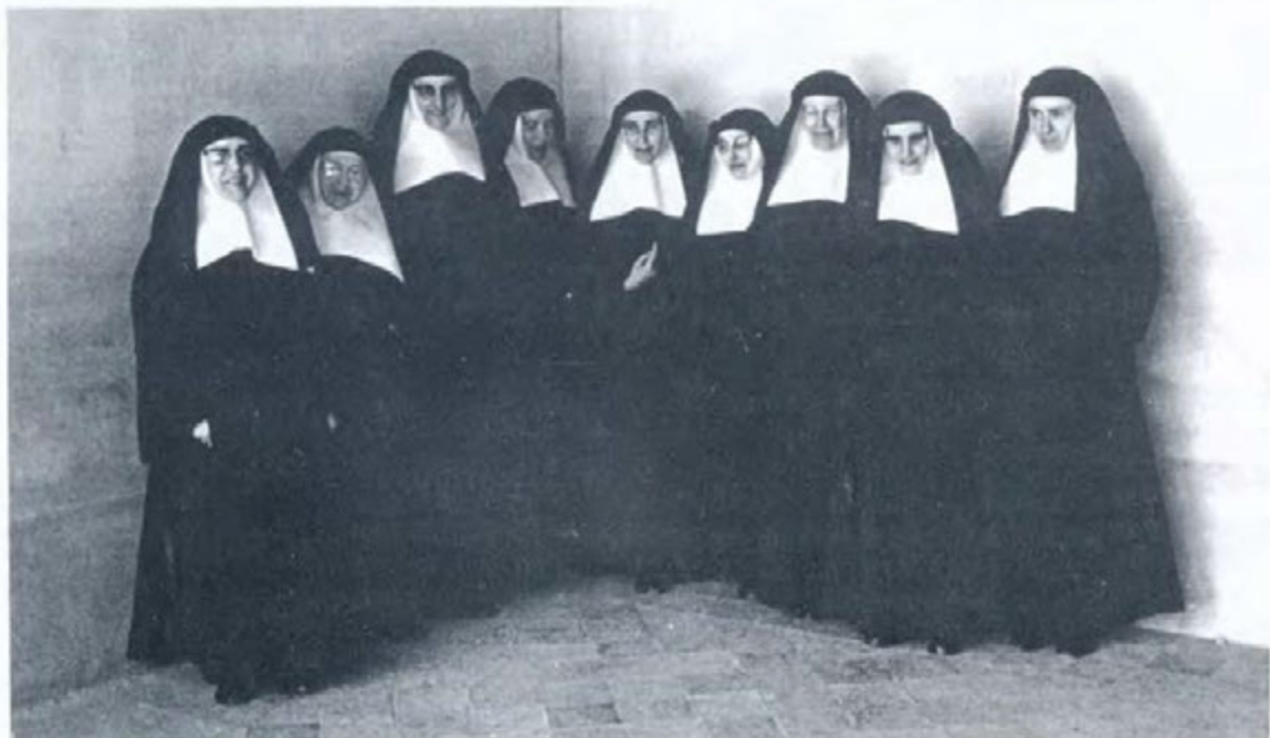
Simpàtica fotografia de la comunitat de les germanes carmelites que impartien la docència a l'escola de la seva titularitat

Les alumnes més grans rebien nocions de tenidoria de llibres, que consistia en càlcul mercantil, màquina, francès, català, taquigrafia.