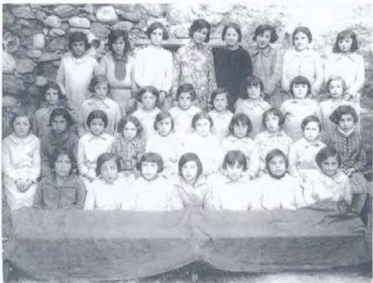
La imatge de la Immaculada Concepció presideix aquest grup d'alumnes assistents al col·legi de les Germanes Carmelites, segons aquesta fotografia de la meitat de la dècada dels anys vint