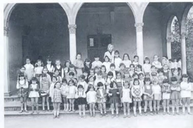
En aquestes dues fotografies hom hi pot veure els més petits i petites de l'escola de les Germanes Carmelites l'any 1970. El marc és el porxo del pati cobert, marc tradicional de fotografies de grup a l'escola.