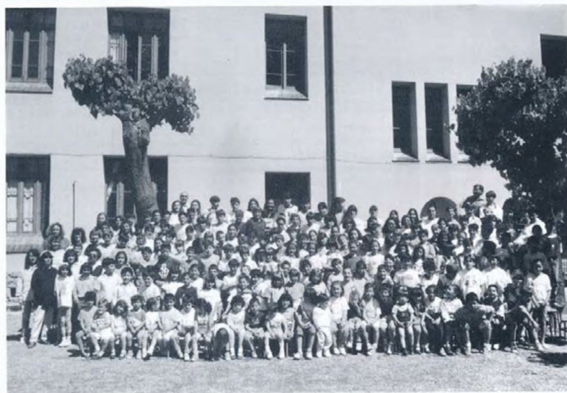
Tot l'alumnat de Sant Joan de les Abadesses, amb els seus professors, en el decurs d'aquest any 1994